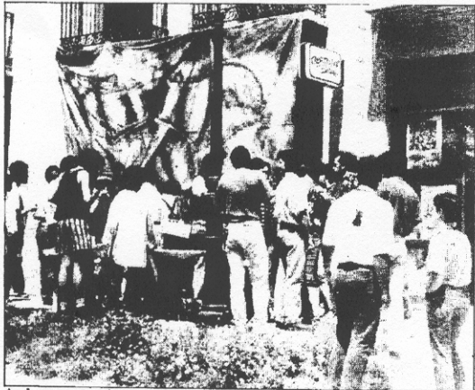
Aurkezpena eta saioaren ondoren lagunartean mahai ingurura.

Aipatu, azkenik, kanta guztiak Negu Gorriakentzat direla, honako hauek ezik: "Song number one" Fugazirena da, "Buru garbiketa" eta "Itxafero mekanikoa" doinu herrikoiak dira eta "Azkena" kantaren hitzak Xabier Montoiaren "Narraztien mintzoa" izeneko liburitik hartu dituzte. Barruko liburuskari aipatzen den bezalaxe, lan hau burutzerakoan, Negu Gorriak ere askotako musika eta zaratak erabili ditu, bai doinuen euskarri bai eta lotura edo osagarri modura ere.