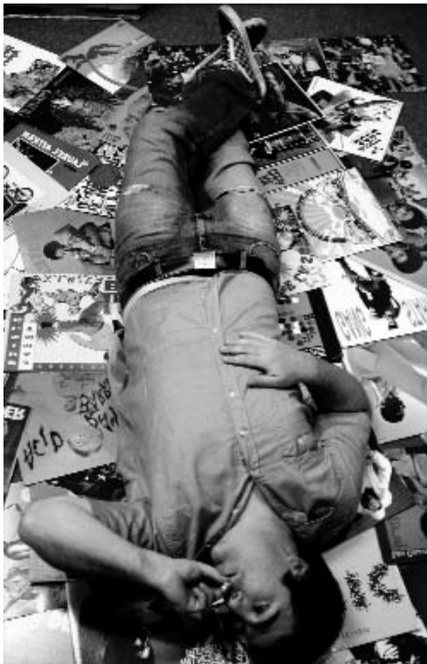
¿CRISIS? El consumo musical se ha diversificado con la tecnología digital.

Desde un sector de la sociedad, cada vez más amplio, se pide un cambio radical de esquemas, tendente a otra forma de ofrecer música, libre, sin intermediarios, con acceso universal, y se sugiere que para eso, nada mejor que las descargas en Internet, sobre todo a través